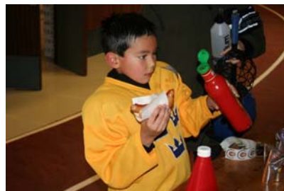
Gott med en korv efter träningspasset!