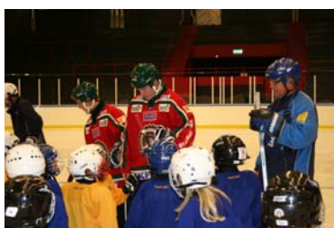
Honken och Sebastian instruerar eleverna på isen

Den tillhörande "prylbytdagen" lockade också många att bli av med gammal utrustning samt att förnya sin egen. Bra drag!