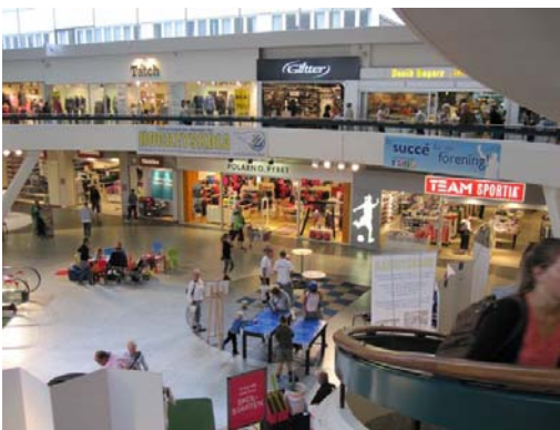
Banderollen på plats!

Detta är en årlig tradition där bl.a. lokala idrottsklubbar kan och får visa upp sig. Bäckén har av tradition alltid varit representerade och var så även i år. Utställningsmonter, banderoller, rullskridskoåkande lirare i full hockeymundering var några av inslagen.